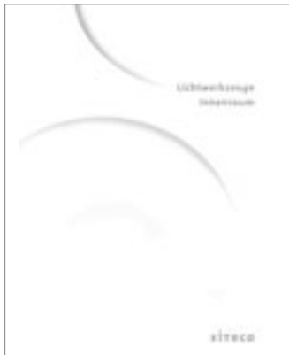
Siteco Lichtwerkzeuge Innenraum, 2008

Alle innovativen Siteco Lichtwerkzeuge für die Realisierung Ihrer Projekte finden Sie in unseren aktuellen Produktkatalogen oder unter www.siteco.de