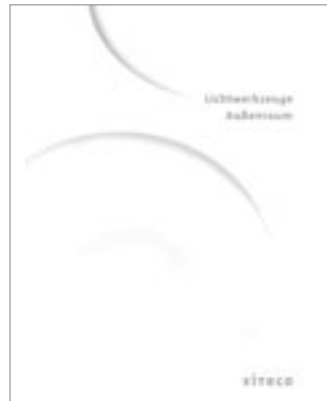
Siteco Lichtwerkzeuge Außenraum, 2008